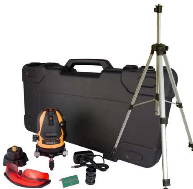
Cross 4.4 rozšířený set