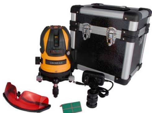
Cross 4.4 základní set

Rozšířená sada navíc obsahuje výsuvný stativ a adptér na stativ s plochou hlavou.